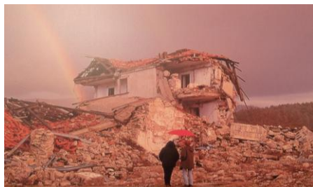
Samostan je srušen 13. veljače 1993. u znak odmazde za VRO „Maslenica“