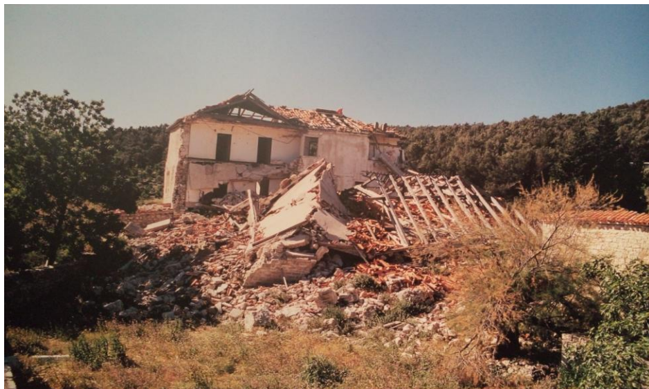
Ostaci srušenog samostana