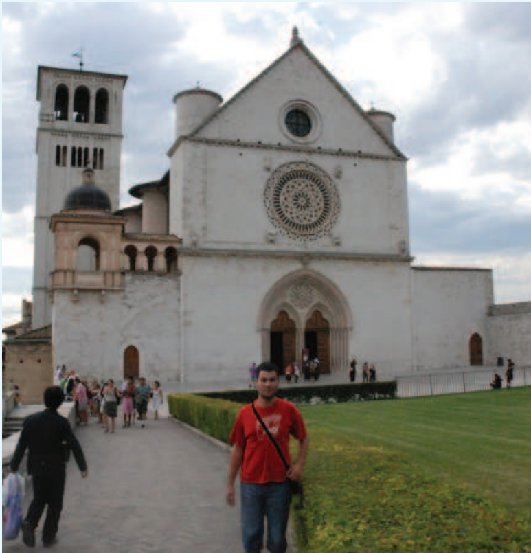
Bazlika sv. Franje u Asizu