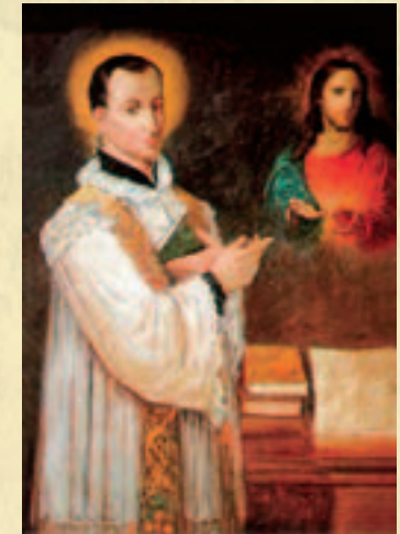
Sv. Klauđije La Colombière

Meditirajući o strpljivosti Isusa koji trpi, sv. Klauđije La Colombière je našao u Srcu Isusovu savršenu školu praštanja. O tome je zapisao: Neka Srce Isusa Krista bude naša škola!